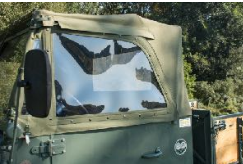
fenêtre UNIMOG 411, 401 (Steckfenster)