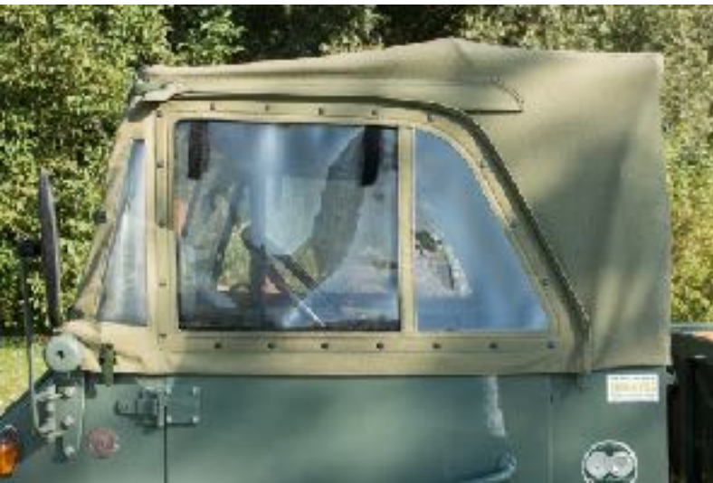
Fenêtre avec enroulement UNIMOG 411, 401