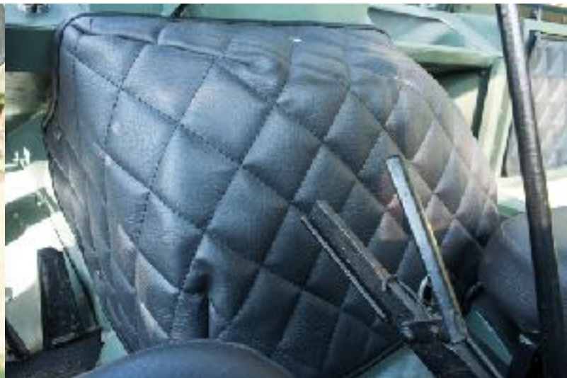
housse de protection moteur UNIMOG 411, 401, 2010 (Motorhaubenbezug)