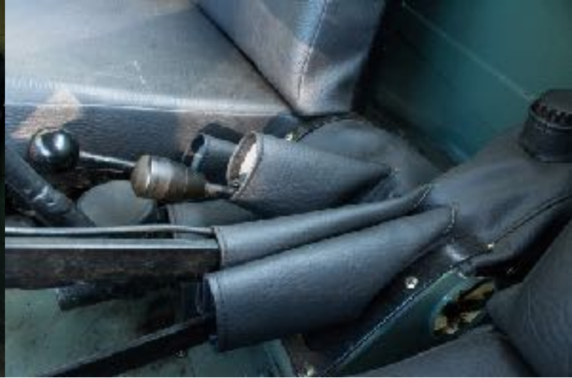
Housse de levier UNIMOG 411, 401 (Hebelabdichtung)