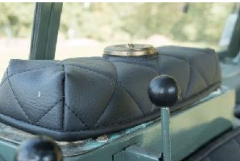
housse de protection pour réservoir d'eau UNIMOG 411, 401, 2010 (Wasserbehälterbezug)