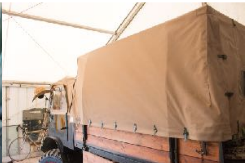
bâche de plateau arrière UNIMOG 411, 401, 2010 (Pritscheplane mit verbindung)