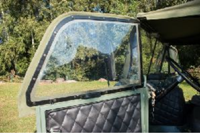
fenêtre version haute UNIMOG 411 (Steckfenster U411 Hoch)