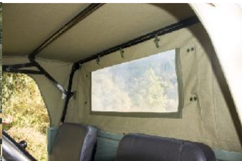
Capote UNIMOG 411, 401 – (Verdeck)