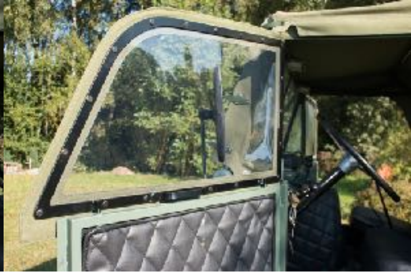
fenêtre version basse UNIMOG 411, 401, 2010 (Steckfenster U nieder)