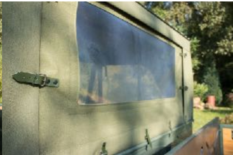
Partie arrière UNIMOG 411, 401 (Rückwand)