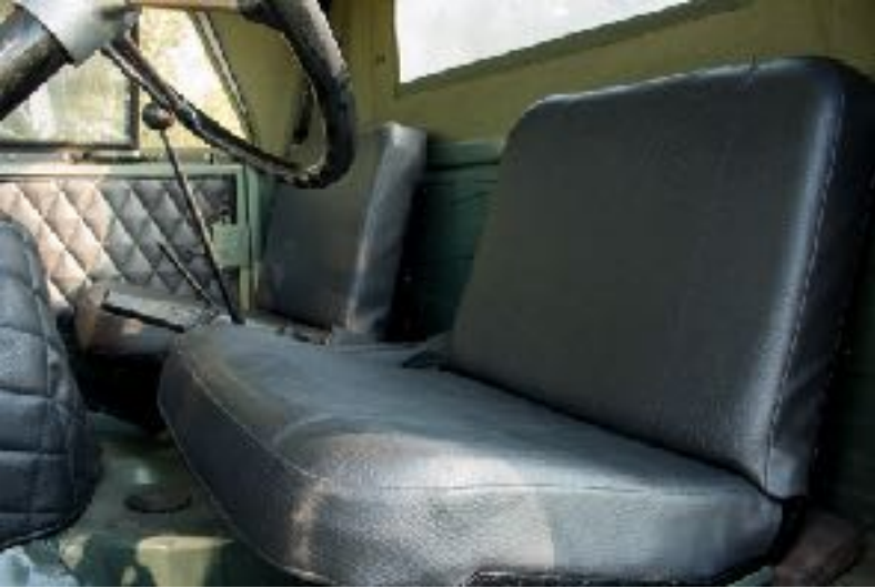
- Housse de siège UNIMOG 411, 401 (Sitzbezug)